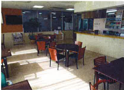
喫茶室（サンカフェ）