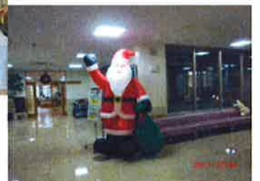
季節を感じる飾り付け