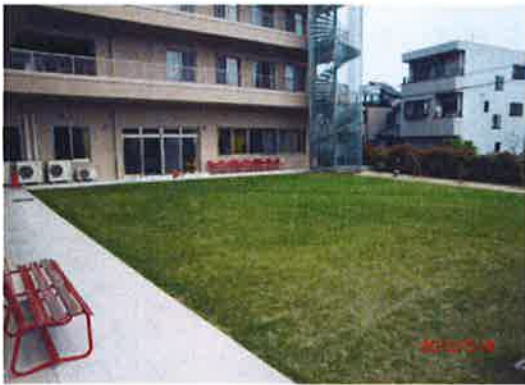
天気の良い日は、芝生に出てくつろぐこともあります。